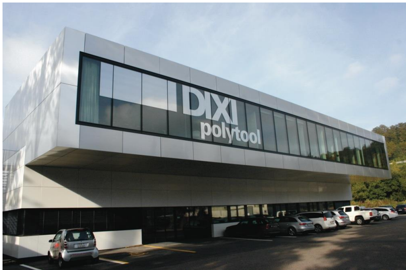
DIXI Polytool S.A. - Avenue du Technicum 37, 2400 Le Locle